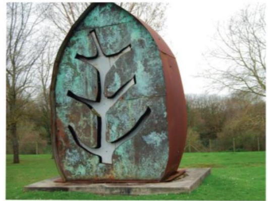
Œuvre de Jean-François Briant